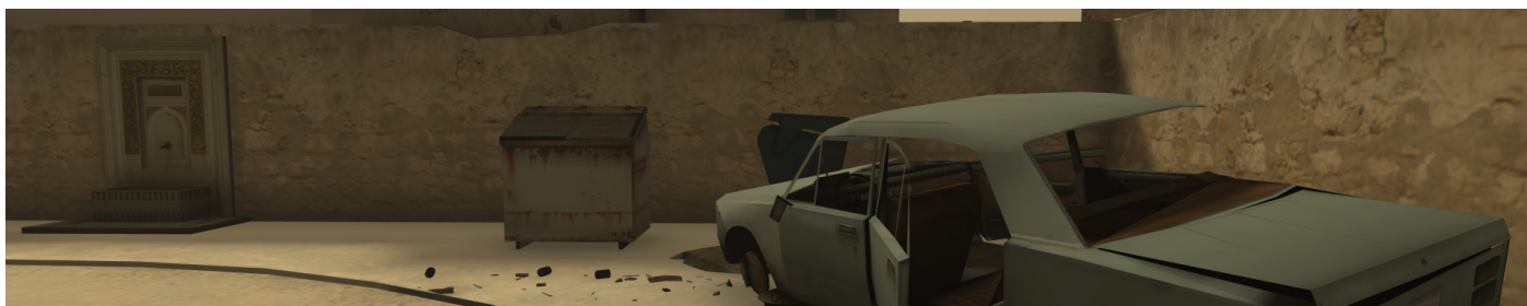
C2Phobia - ESPT

Les recherches ont généré des résultats probants mettant en lumière l'intérêt de l'utilisation de la réalité virtuelle auprès des patients ayant un stress du trouble post-traumatique.