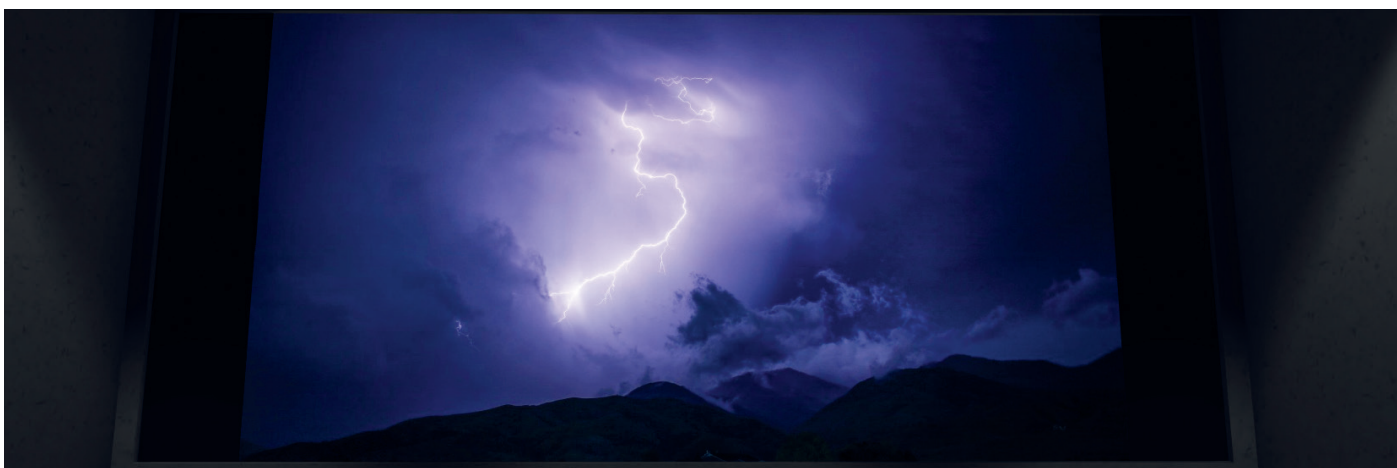
C2Custom - Orage

Accéder gratuitement à la version découverte de C2Custom en créant un compte MyC2Care .